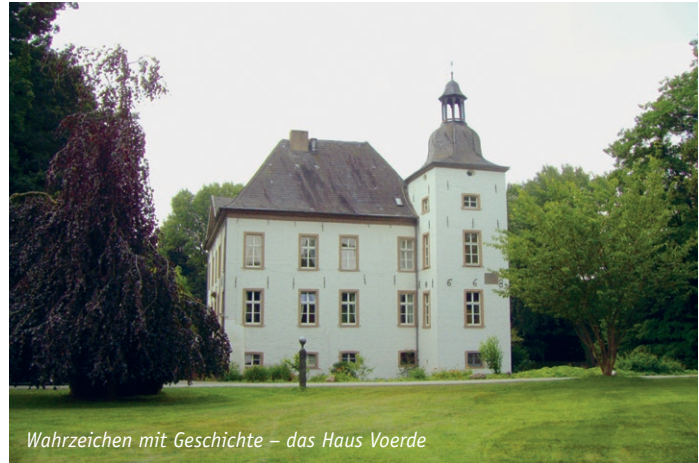
Wahrzeichen mit Geschichte – das Haus Voerde

Nachhaltige Mobilitätskonzepte entwickeln: Die zukünftigen Siedlungsentwicklungen müssen unabhängig vom motorisierten Individualverkehr funktionieren. In der dezentralen Siedlungsstruktur von Voerde ist die Qualifizierung der Fuß- und Radwegenetze zwischen den Ortsteilen eine zentrale Aufgabe bis 2030. Der Umgang mit dem motorisierten Verkehr muss die Balance zwischen Erreichbarkeit und Belastung schaffen.