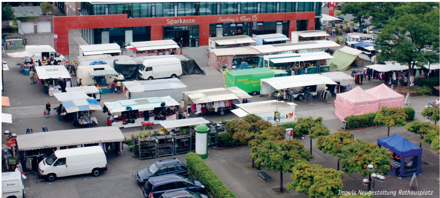
Impuls Neugestaltung Rathausplatz

HEIMATVOERDE: Vielfältige Nachbarschaften schaffen; Stadtquartiere als Minizentren und Sozialräume stärken | GESTALTVOERDE: Unverwechselbare, nachhaltige Ortsgestalten entwickeln; Stadtbild profilieren; Urbanes Zentrum Voerde umbauen und stärken