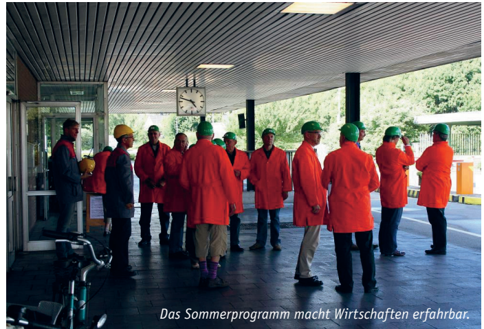
Das Sommerprogramm macht Wirtschaften erfahrbar.

Am 12. August 2008 ging es unter dem Stichwort „Wandel“ um Veränderungen im Schulalltag, in der Landwirtschaft, in Industrie- und Tourismuswirtschaft. Dazu standen Besichtigungen der Regenbogenschule in Möllen, des „Corus“-Aluminiumwerks, des landwirtschaftlichen Betriebs Bernds, des Reiterhofs Hinnemann und eine Schifffahrt zu den Auskiesungen am Rhein auf dem Programm. „Wohnen“ war am 22. August 2008 das Thema. Menschen aus Voerde haben dazu ihre Wohnungen geöffnet und so Einblick gewährt in ein Bahnarbeiterhaus, ein freistehendes Einfamilienhaus, ein Hochhaus in der Innenstadt, Siedlungen der 50er und 70er Jahre, aktuelle Neubausiedlungen und ein Altenheim. Die Exkursionsteilnehmer kamen ins Gespräch mit den Besitzern der Wohnungen und sprachen miteinander über ihre eigenen Vorstellungen vom Wohnen. Am 30. August 2008 drehte sich alles um „Wasser“. Es ging um Hochwasserschutz am Parkplatz „Arche“, wo der Hochwasserstand mit einem blauen Netz simuliert war. Eine Radtour durch die Mommniederung ermöglichte Einblicke in die Problematik der durch den Bergbau abgesenkten Bereiche und in das Entwässerungskonzept. Ein Besuch auf dem Rheindeich, am Hafen Emmelsum