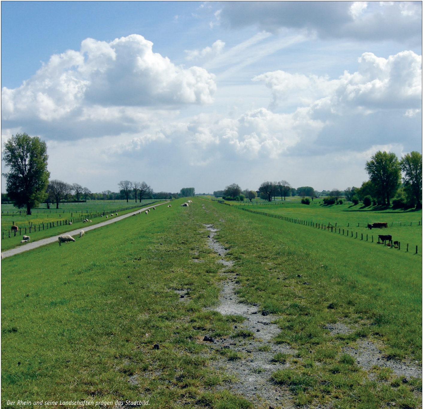
Der Rhein und seine Landschaften prägen das Stadtbild.