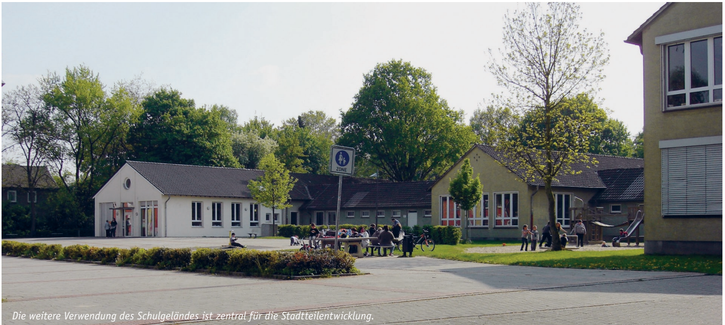
Die weitere Verwendung des Schulgeländes ist zentral für die Stadtteilentwicklung.

CHANCEVOERDE Neue Konzepte für Kinderbetreuung und Jugendförderung weiterentwickeln | DIALOGVOERDE Dialog zwischen Politik, Verwaltung und Bürgern gestalten | HEIMATVOERDE Vielfältige Nachbarschaften schaffen; Stadtquartiere als Minizentren und Sozialräume stärken | GESTALTVOERDE Unverwechselbare, nachhaltige Ortsgestalten entwickeln