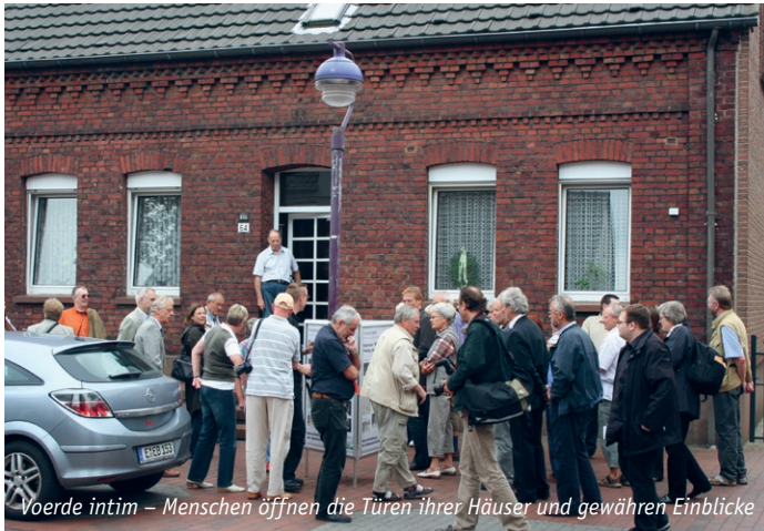
Voerde intim – Menschen öffnen die Türen ihrer Häuser und gewähren Einblicke

Interessierte teilnahmen. Zwei Rundschreiben haben seither über den Verlauf von VOERDE2030 informiert und die nächsten Schritte bekannt gemacht. Nächste Meilensteine sind weitere öffentliche Präsentationen und Diskussionen .