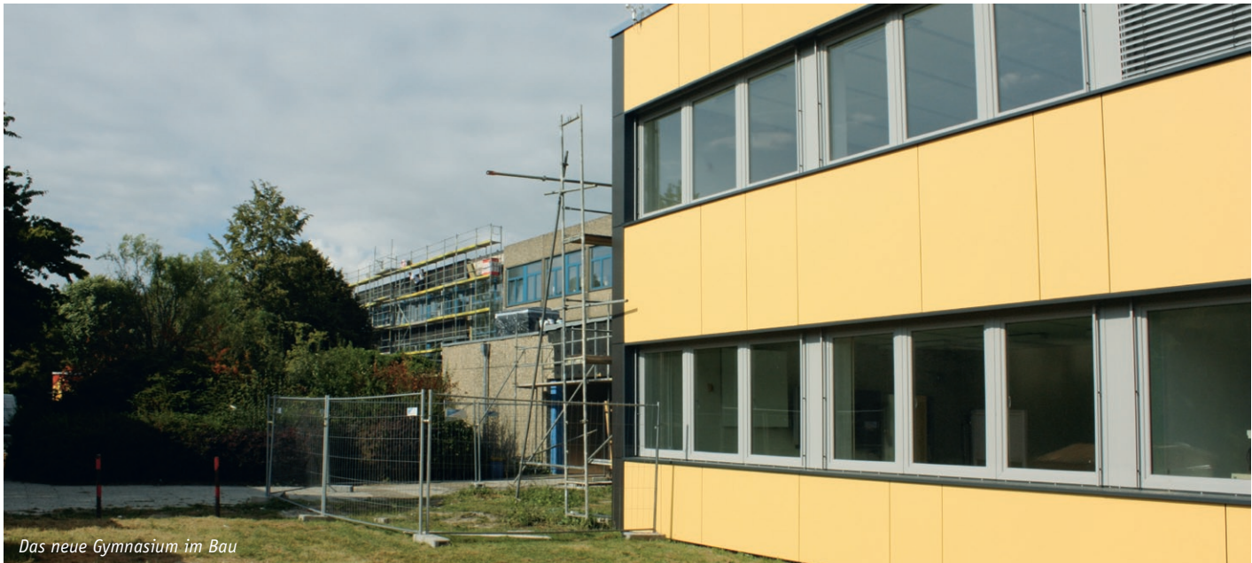
Das neue Gymnasium im Bau

CHANCEVOERDE: Schnittstellen zwischen Wirtschaft, Gesellschaft und Schule gestalten; Bildungslotse zur Orientierung im Chancen-Dschungel einsetzen; Neue Konzepte für Kinderbetreuung und Jugendförderung weiterentwickeln; Voerde als Schullandschaft denken; Wirtschaftsförderung breit diskutieren | DIALOGVOERDE: Netz für Engagement von Bürgerschaft und Wirtschaft aufbauen