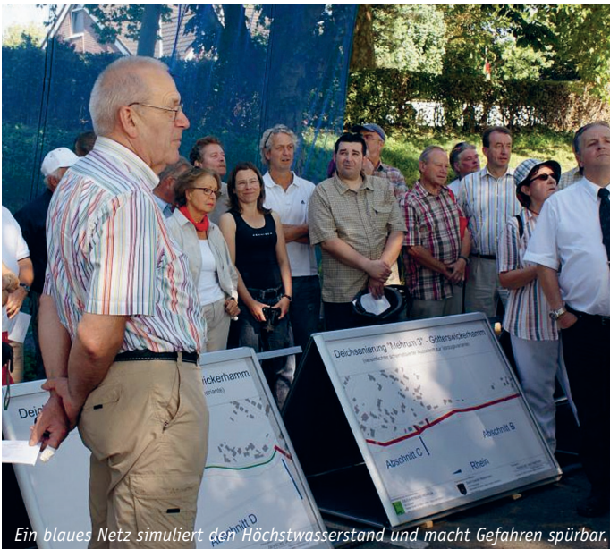
Ein blaues Netz simuliert den Höchstwasserstand und macht Gefahren spürbar.

Zu Beginn des Prozesses fand am 19. Juni 2008 die erste öffentliche Informationsveranstaltung im Rathausfoyer statt, an der etwa 100